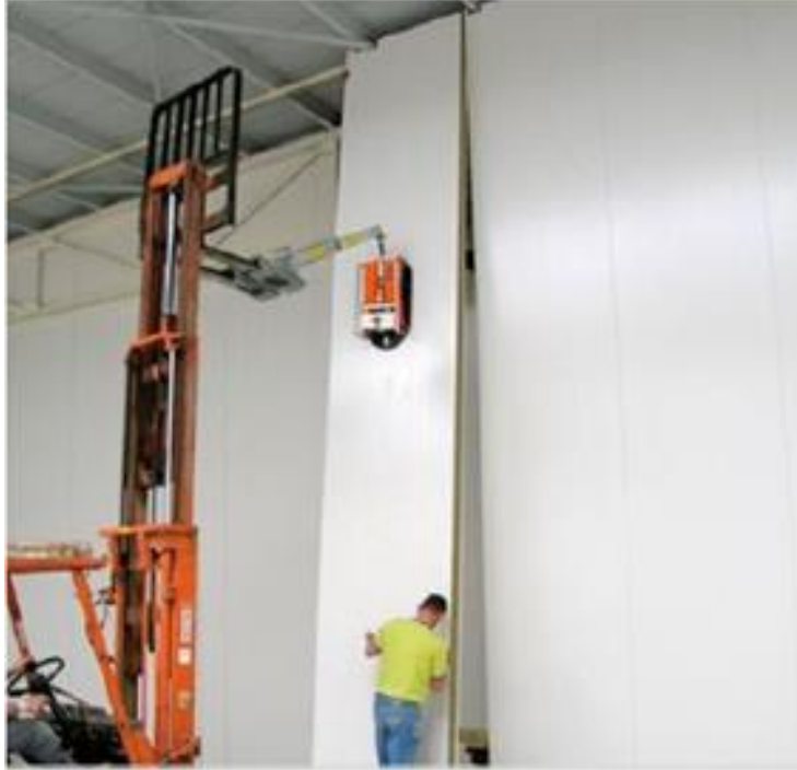
Εσωτερική εγκατάσταση πάνελ τοίχου σάντουιτς με την υποστήριξη ενός περονοφόρου φορτηγού.