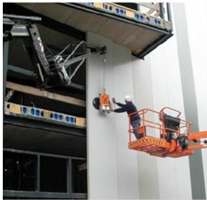
Εύκολη εγκατάσταση πάνελ σάντουιτς με φορτηγό προσέγγισης.