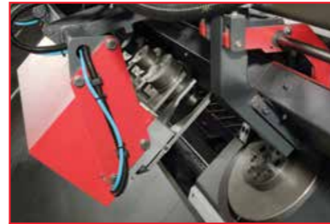
Automatic bending pin changer