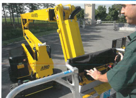
Grande maneggevolezza e semplicità nei movimenti Great manoeuvrability and simple movements