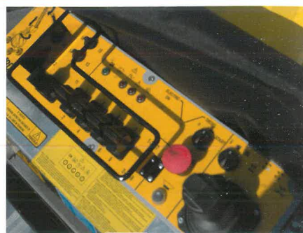
Scatola comandi in piattaforma dotata di Joystick Control panel with joystick on platform

Oscillating axle which allows platform to operate safely on uneven ground