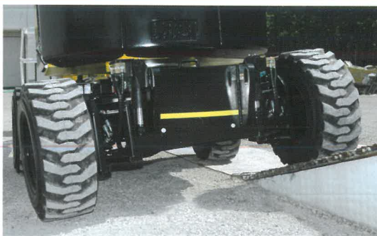
Assale oscillante per permettere alla piattaforma di lavorare su terreni sconnessi ed in sicurezza

4 drive wheels and 4 steering wheels for better handling and movement