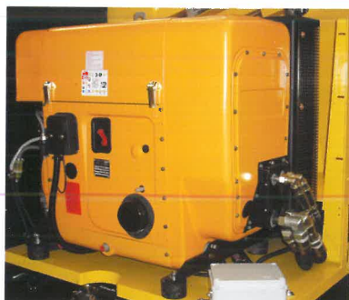
Motore diesel con vano motore facilmente ispezionabile per manutenzioni Diesel engine with easily-accessible motor compartment for inspection and maintenance