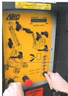
Quadro comandi a terra con pannello per diagnostica Ground control panel with diagnostic display

Ersatzteillager, schnelle Versanddienste, “direkte Verbindung” zum Kunden, Schulungskurse für Techniker.