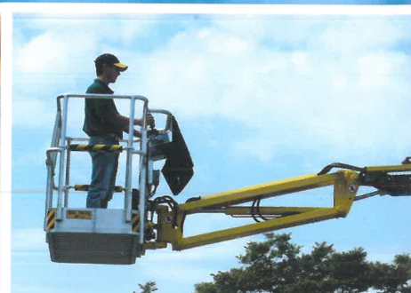
Facilitazione nel raggiungimento di punti di lavoro particolari, mediante jib Easy to reach difficult working positions, thanks to the jib