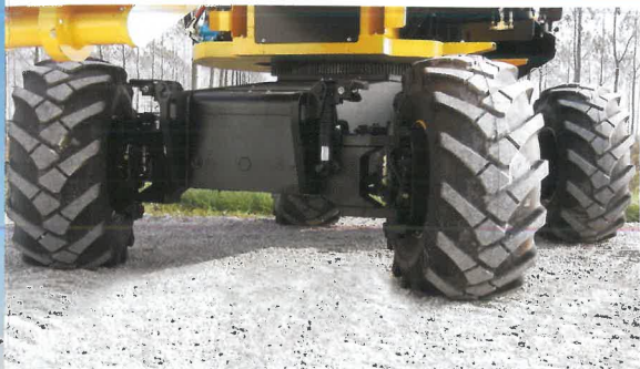
4 ruote motrici e 4 ruote sterzanti per maggiore agilità di manovra

Die Firma TIGIEFFE wurde als Serviceunternehmen für Hubarbeiten gegründet und begann dann im Jahr 1988 mit der Produktion von selbstfahrende Hubarbeitsbühnen. Die Palette der AIRO Produkte ist in zwei eigentliche Modellgenerationen aufgeteilt: